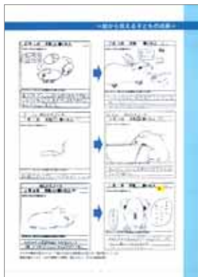
絵から見える子どもの成長